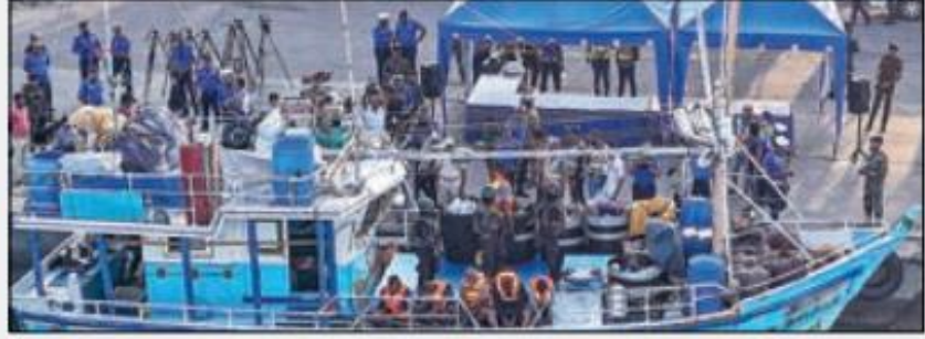
▲ பறிமுதல் செய்யப்பட்ட ஹெராயின் போதைப்பொருள் கடத்திய படகு.

பின்னர் படகில் சோதனை செய்தபோது 298 பொட்டலங்களில் பதுக்கி வைத்திருந்த